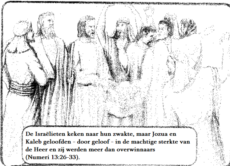
De Israëlieten keken naar hun zwakte, maar Jozua en Kaleb geloofden - door geloof - in de machtige sterkte van de Heer en zij werden meer dan overwinnaars (Numeri 13:26-33).

Vandaag beweren veel mensen in God te geloven, maar zij geloven niet - door geloof. Net zoals de Israëlieten. Toen de Israëlieten reuzen tegenkwamen in hun leven, maakten zij de tegenstander groter dan de Hemelse Vader. Dit is de reden waarom hun problemen zo hardnekkig waren. Let op: