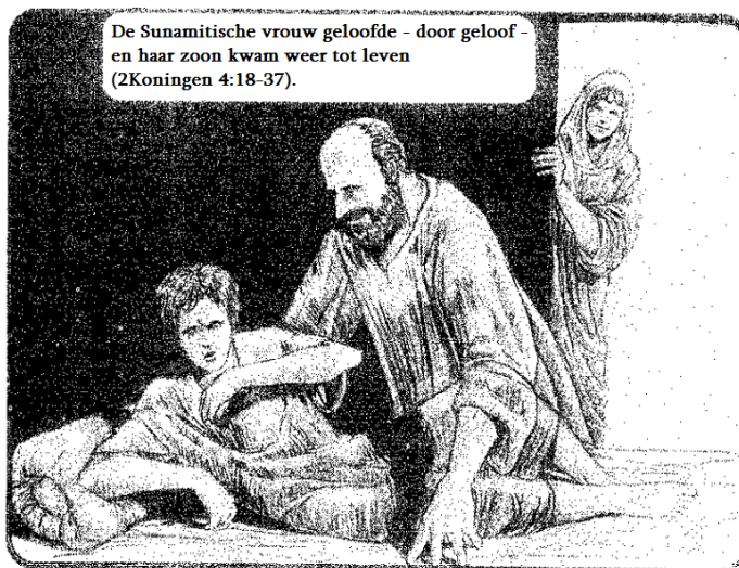
De Sunamitische vrouw geloofde - door geloof - en haar zoon kwam weer tot leven (2Koningen 4:18-37).