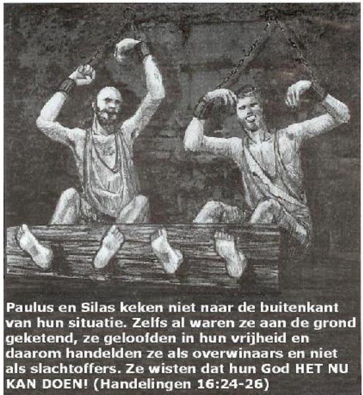
Paulus en Silas keken niet naar de buitenkant van hun situatie. Zelfs al waren ze aan de grond geketend, ze geloofden in hun vrijheid en daarom handelden ze als overwinnaars en niet als slachtoffers. Ze wisten dat hun God HET NU KAN DOEN! (Handelingen 16:24-26)

Paulus en Silas waren mannen die geloofden dat hun God een God van nu was. Toen ze in de gevangenis werden gegooid, gingen ze niet op een beter moment wachten om God te loven en te prijzen. De buitenkant van hun situatie was dan wel een smerige, onaangename gevangenis, maar zij keken naar de hemel en verheerlijkten hun Schepper. Aan de buitenkant waren zij gevangenen, maar aan de binnenkant hadden zij een beeld van hun toekomstige vrijheid die ze hadden ontvangen. Zij wisten dat niet één situatie permanent is. Zij