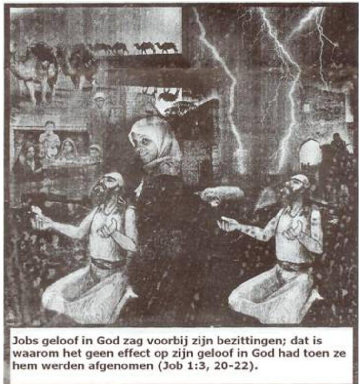
Jobs geloof in God zag voorbij zijn bezittingen; dat is waarom het geen effect op zijn geloof in God had toen ze hem werden afgenomen (Job 1:3, 20-22).

Het eerste ingrediënt van Christus' standaard van geloof is kennis. "Hoe zullen zij dan Hem aanroepen, in wie zij niet geloofd hebben? Hoe geloven in Hem, van wie zij niet gehoord hebben? Hoe horen zonder prediker? (Romeinen 10:14) . U verkrijgt deze kennis door uw Bijbel met toewijding te lezen - dan ontdekt u wie God is, wie u bent en wat God heeft bereid voor degenen die Hem liefhebben (1 Korintiërs 2:9) . Vóór Paulus' ontmoeting met Jezus Christus vervolgde hij de Kerk. Ná zijn ontmoeting met de waarheid - Jezus Christus - geloofde hij en werd een dienstknecht van rechtvaardigheid. Niemand kan geloven als hij nog in onwetendheid is. Niemand kan geloven zonder kennis, zoals de apostel Paulus zei: "...hoewel ik vroeger een godslasteraar en een vervolger en een geweldenaar was. Maar mij is ontferming bewezen, omdat ik het in mijn onwetendheid, uit ongeloof, gedaan heb." (1 Timoteüs 1:13). Lees daarom Gods Woord, want hierin is de kennis die u nodig hebt om op Zijn manier te geloven.