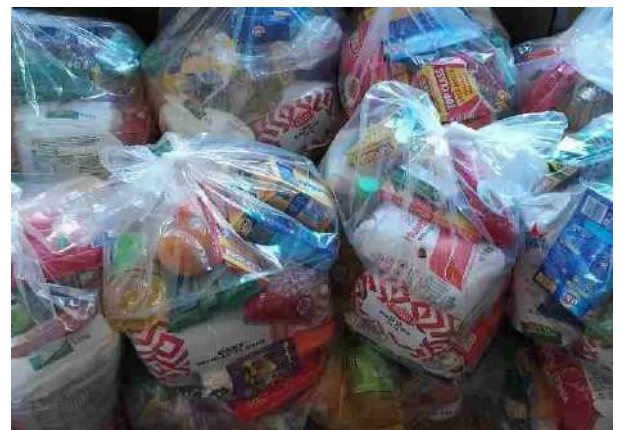
De Hampers (voedselpakketten)

Elke maand krijgen de door ons geselecteerde armste gezinnen een voedselpakket . Deze pakketten worden betaald door gezinnen uit Nederland die dan maandelijks € 25,- sturen en die dan een gezin hebben geadopteerd . Ze krijgen dan een document met gegevens en een foto van hun toegewezen gezin.