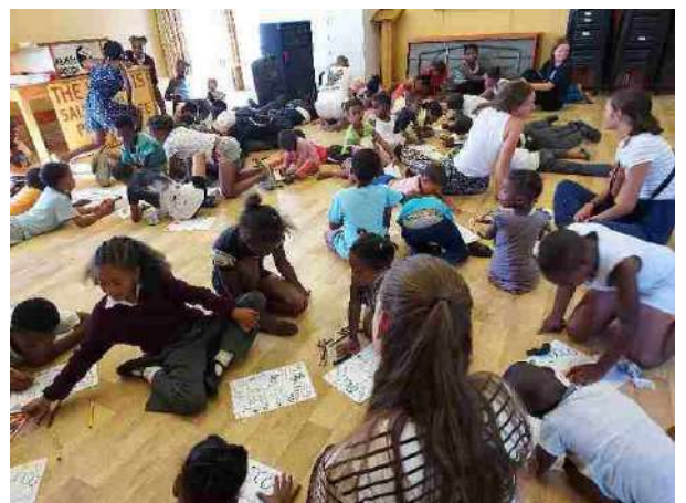
Kleuren of werkje over het Bijbels onderwerp