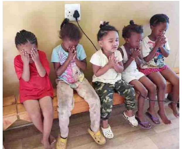
Kleintjesclub bidden het "Onze Vader".

De Kinderclubs lopen ook weer goed. Daar hebben we op woensdagmiddag hulp bij van vrijwilligers van Youth For Christ . De meeste vrijwilligers komen uit Duitsland. Op maandag na het eten hebben de kleine kinderen hun club. Daarnaast zijn er Jeugdavonden . En binnenkort starten we weer met een meidengroep. Als wij zelf weer meer vrijwilligers krijgen, starten we weer met meer clubs. Ik deed er in het verleden zelf altijd 5 in de week dat was veel werk aan voorbereiding.