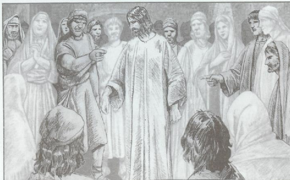
Er zijn twee manieren om naar Jezus te kijken, de menselijke en de goddelijke. Zij, die vanuit menselijk oogpunt naar Jezus kijken, kijken met menselijke ogen en zien Jezus' menselijke behoeften. (Johannes 7:1-5)

Uw buitenkant heeft voedsel nodig voor uw ziel – dat wat u met geld niet kunt kopen. Waar ziet u uw behoeften? Veel mensen zijn hun hele leven bezig voor hun