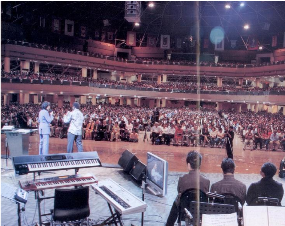
Wij belijden Christus voor de wereld. Wij belijden de volheid van Zijn genade. Wij belijden de integriteit van de openbaring.

Wanneer we zijn Woord belijden, waakt Hij erover om het goed te maken. Wat wij belijden bezitten wij; onze belijdenis geeft ons bezit. Ik bedoel dat onze belijdenis problemen oplost. Ik belijd dat Jezus mijn Heer en Heiland is, dus bezit ik redding. Ik belijd dat ik door Zijn striemen genezen ben.