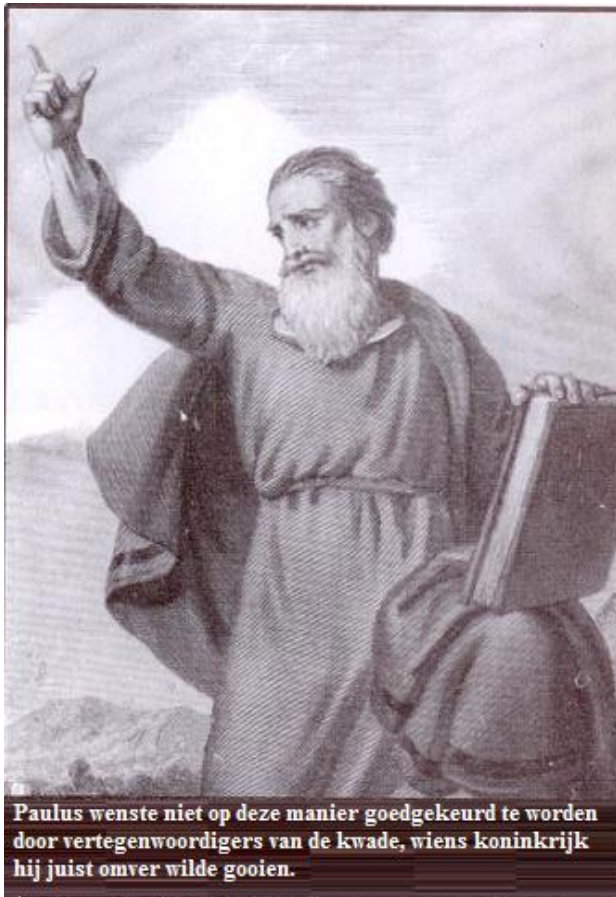
Paulus wenste niet op deze manier goedgekeurd te worden door vertegenwoordigers van de kwade, wiens koninkrijk hij juist omver wilde gooien.

harten en zijn gedachten is fundamenteel voor ons geloof en heilig leven ( Spreuken 4:23; Kolossenzen 3:1-2 ). Onze belijdenis geeft ons bezit. Onze belijdenis lost problemen op. Heeft uw belijdenis uw problemen opgelost? Heeft het u bezit gegeven? Als dat niet het geval is, weet dan dat u niet belijdt wat u in uw hart gelooft. In Handelingen 16:16–eind droeg satan aan wat in zichzelf een waar getuigenis was, zodat hij hierdoor de apostelen hun goede naam kon vernietigen, en hun bruikbaarheid. Maar Paulus wenste niet op deze manier goedgekeurd te worden door vertegenwoordigers van de kwade, wiens koninkrijk hij juist omver wilde gooien. Dus zegt de Bijbel dat hij de boze geest bestrafte en uit de slavin stuurde ( Handelingen 16:18 ).