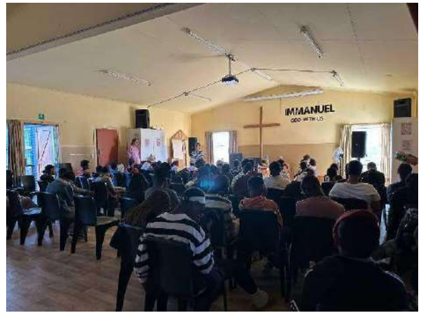
Clubwerk in Oupad Zuid-Afrika

Inmiddels is het eerste koppel uit de kerk in Sifoe in het huwelijk getreden en Moses heeft dit huwelijk ingezegend